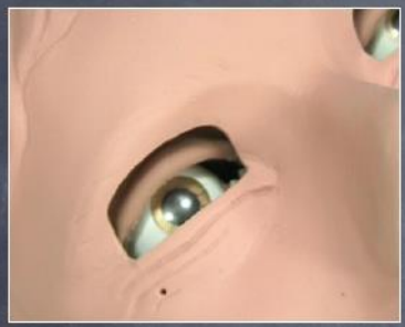
training session on simulators